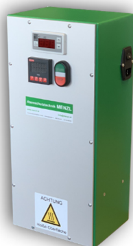
Trockengebläse TG 05