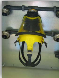
Zur Trocknung eingebrachte Maske

Die feuchte Abluft entweicht über eine Öffnung an der Schrankoberseite in den Raum. Der Trockenschrank kann als Tischmodell oder an einer Wand montiert verwendet werden.